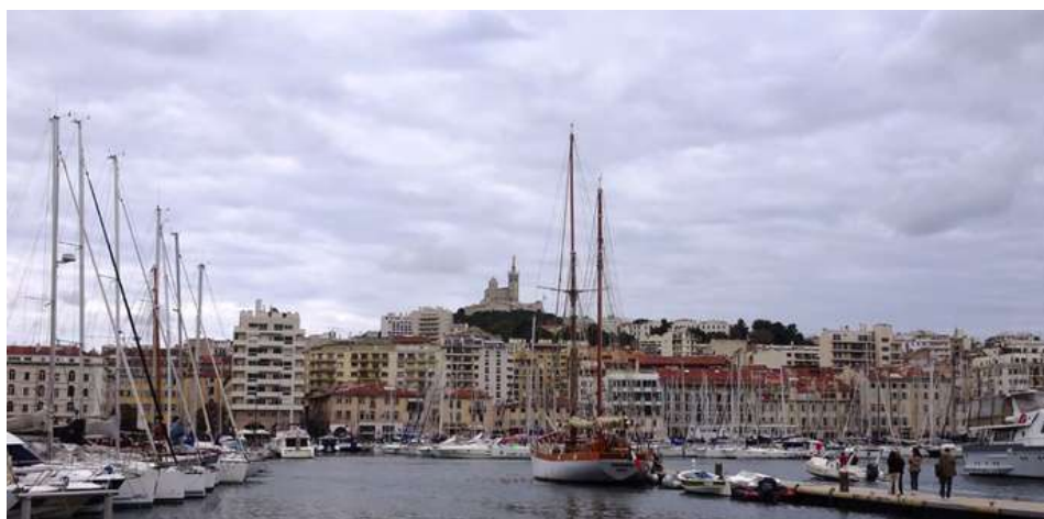
Oh peuchère la Bonne Mère