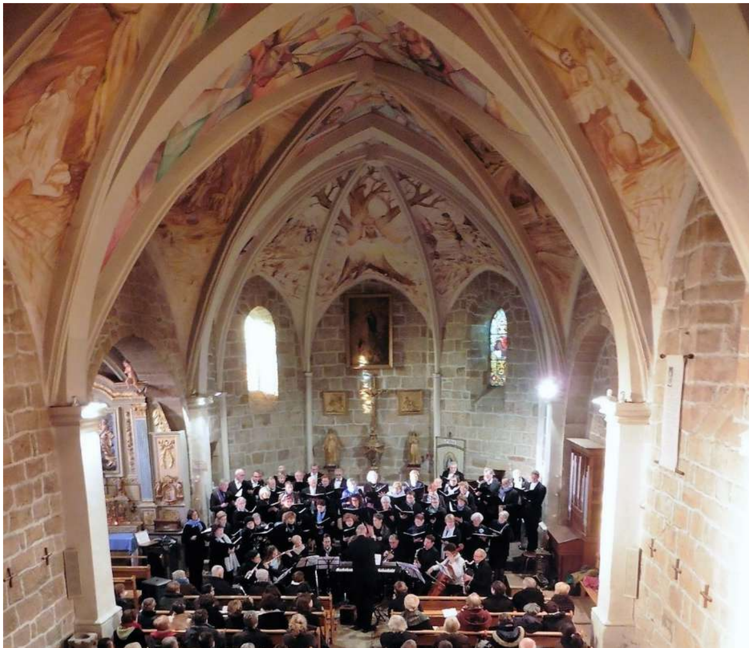
Le Coeur de Figeac