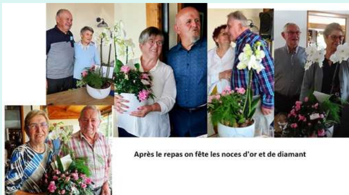
Après le repas on fête les noces d'or et de diamant