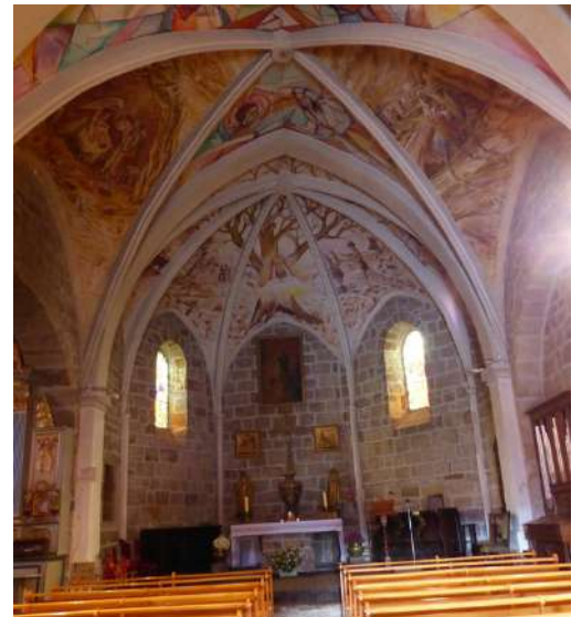
ND du Mas du Noyer